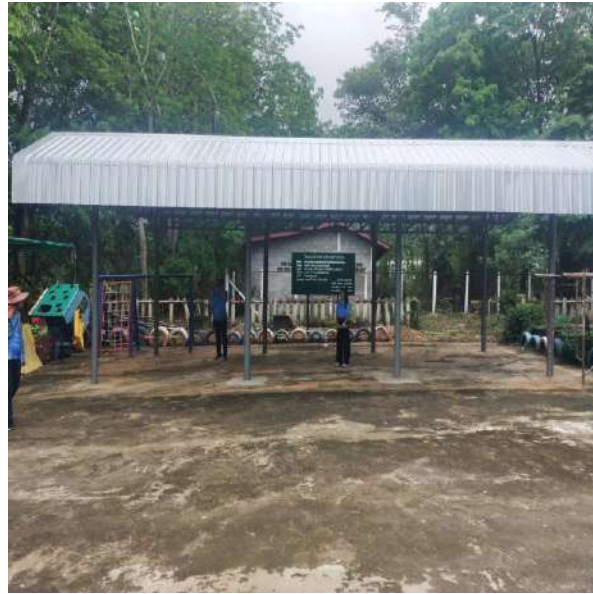
โครงการก่อสร้างอาคารสำหรับเด็กปฐมวัยศูนย์พัฒนาเด็กเล็กบ้านห้วยหินฝน หมู่ที่ 8