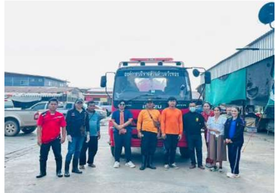
โครงการวางทอ้งบ้านสวยเมืองสุข คลองสะอาด