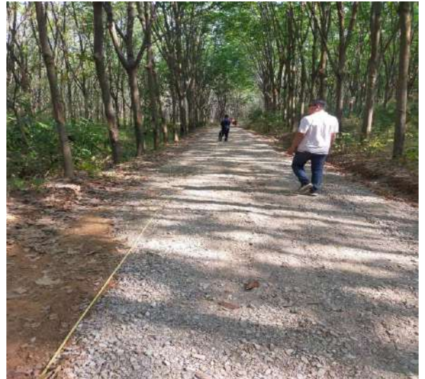
โครงการปรับปรุงถนนสายการเกษตรสายเขาลวกบ้านซับใหญ่ หมู่ที่ 13