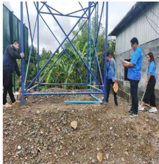
โครงการย้ายห้องประปาพร้อมก่อสร้างฐานจากรองรับห้องถึงและงานขยายเขตท่อเมนตึประปาบ้านผาทอง ม.11