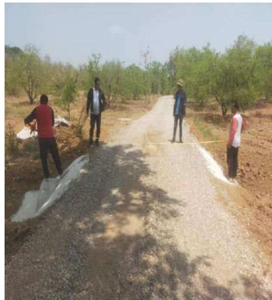
โครงการปรับปรุงถนนสายการเกษตรซอย 3 บ้านนาทุ่งใหญ่ หมู่ที่ 7