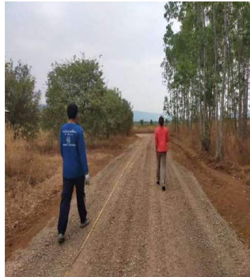
โครงการปรับปรุงถนนสายการเกษตรซอย 8 บ้านนาระยะ ม.1