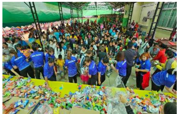
โครงการถวายทองเจ้าพ่อพญาแล