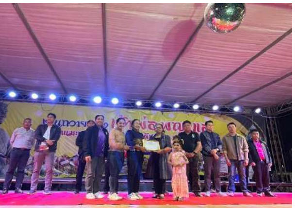
โครงการอนุรักษ์และสืบสานประเพณีลอยกระทง