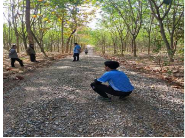
โครงการปรับปรุงถนนสายการเกษตรซอยมะไฟหวาน บ้านห้วยร่วม ม.2