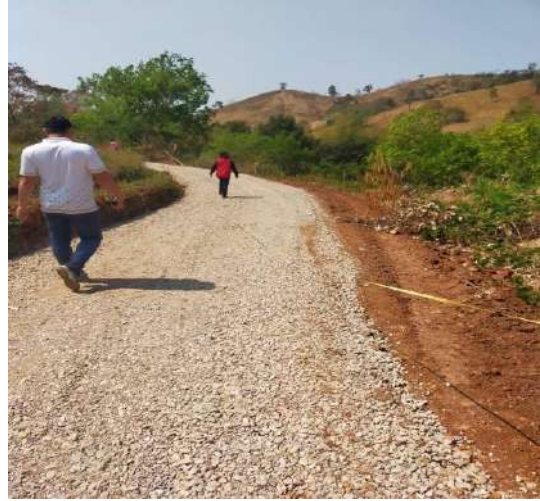
โครงการปรับปรุงถนนสายการเกษตรสายวังข้างต่าย บ้านปรางค์มะค่า ม.3