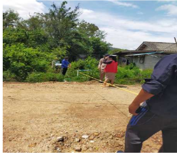
โครงการขยายเขตท่อเมนจ่ายน้ำระบบประปาหมู่บ้านบ้านวังใหญ่หมู่ที่ 4