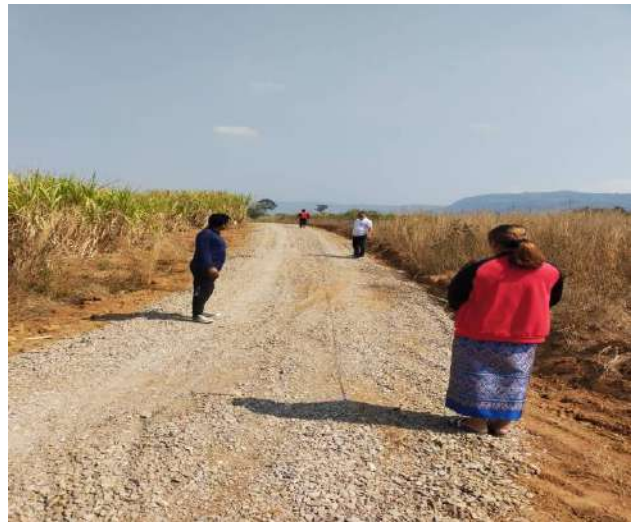
โครงการปรับปรุงถนนสายการเกษตรซอยนายเทวี สุดหอม บ้านห้วยหินฝน ม.8