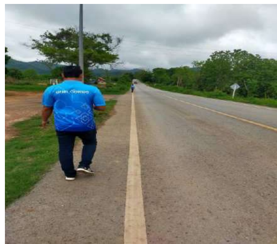
โครงการขยายเขตท่อเมนจ่ายน้ำระบบประปาหมู่บ้านบ้านหินดาดหมู่ที่ 10