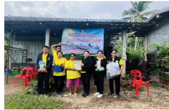
โครงการ Big Cleaning Day