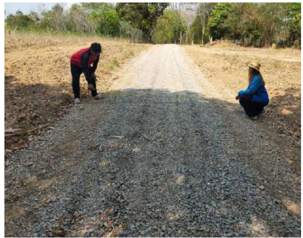
โครงการปรับปรุงถนนสายการเกษตรไร่ส.บัวพันธ์ บ้านซับชมภู ม.6