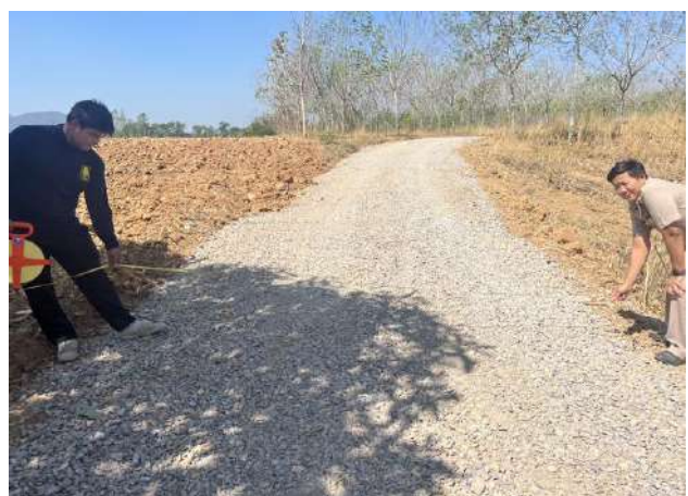
โครงการปรับปรุงถนนสายการเกษตรซอยเข้าไร่ นายบรรจง บ้านน้ำตกลำคำ ม.12