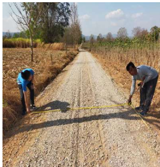
โครงการปรับปรุงถนนสายการเกษตรซอย SML-สวนแก้ว บ้านเนินทราย หมู่ที่ 9