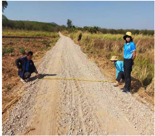
โครงการปรับปรุงถนนสายการเกษตรซอยอรุณฟาร์ม บ้านหนองตะเคียน ม.5